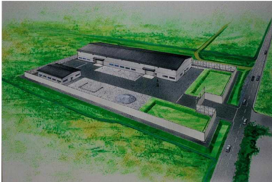
■仮設施設(木材保管庫)の将来イメージ