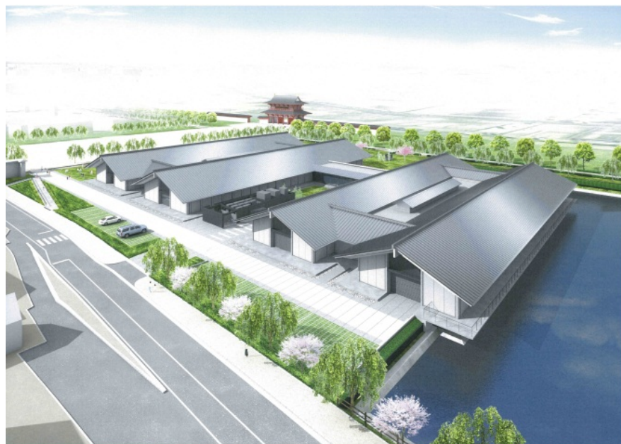
平城宮跡展示館完成予想図

また、「平城宮跡展示館」周辺の朱雀大路、二条大路についても、今後、整備を進めます。