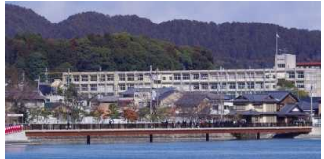
完成した南郷ほたる橋