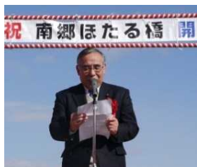
宮崎南郷学区自治連合会長