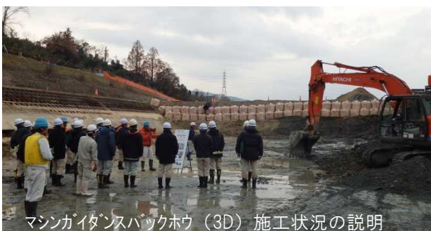
マシンガイドンスバックホウ（3D）施工状況の説明