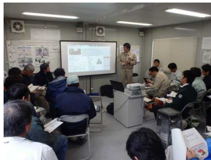
情報化施工の説明（本局施工企画課）