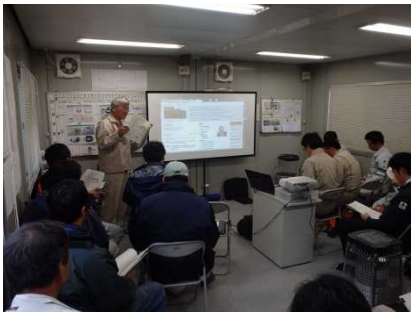
工事概要説明（瀬田川出張所長）