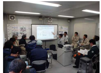
情報化施工技術活用説明（施工者）