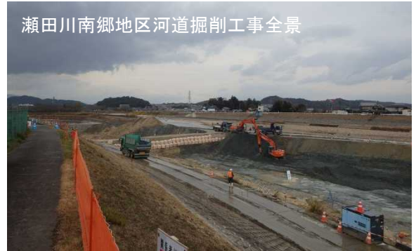
瀬田川南郷地区河道掘削工事全景

開催日時：平成26年12月12日（金）14:00～15:30 見学工事：瀬田川南郷地区河道掘削工事 見学技術：トータルステーションによる出来形管理（土工） マシンガイドンスバックホウ（3D） 参加人数：25名 （地方自治体職員5名、管内工事技術者7名含む） 主催：琵琶湖河川事務所