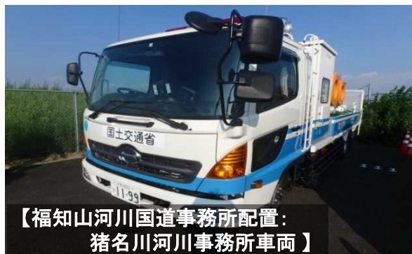
【福知山河川国道事務所配置： 猪名川河川事務所車両】