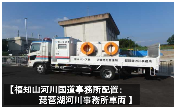
【福知山河川国道事務所配置： 琵琶湖河川事務所車両】