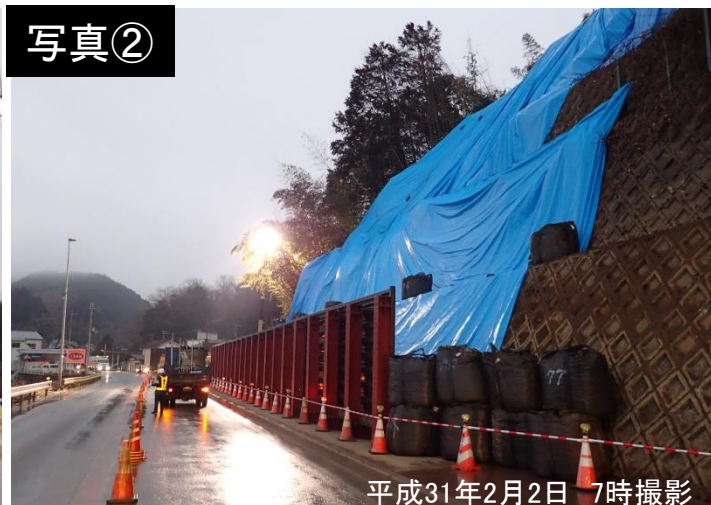
平成31年2月2日 7時撮影