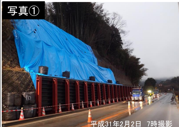
平成31年2月2日 7時撮影