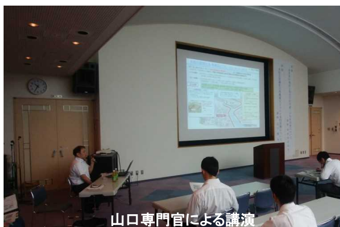
山口専門官による講演