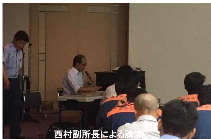
西村副所長による講演