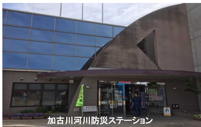
加古川河川防災ステーション