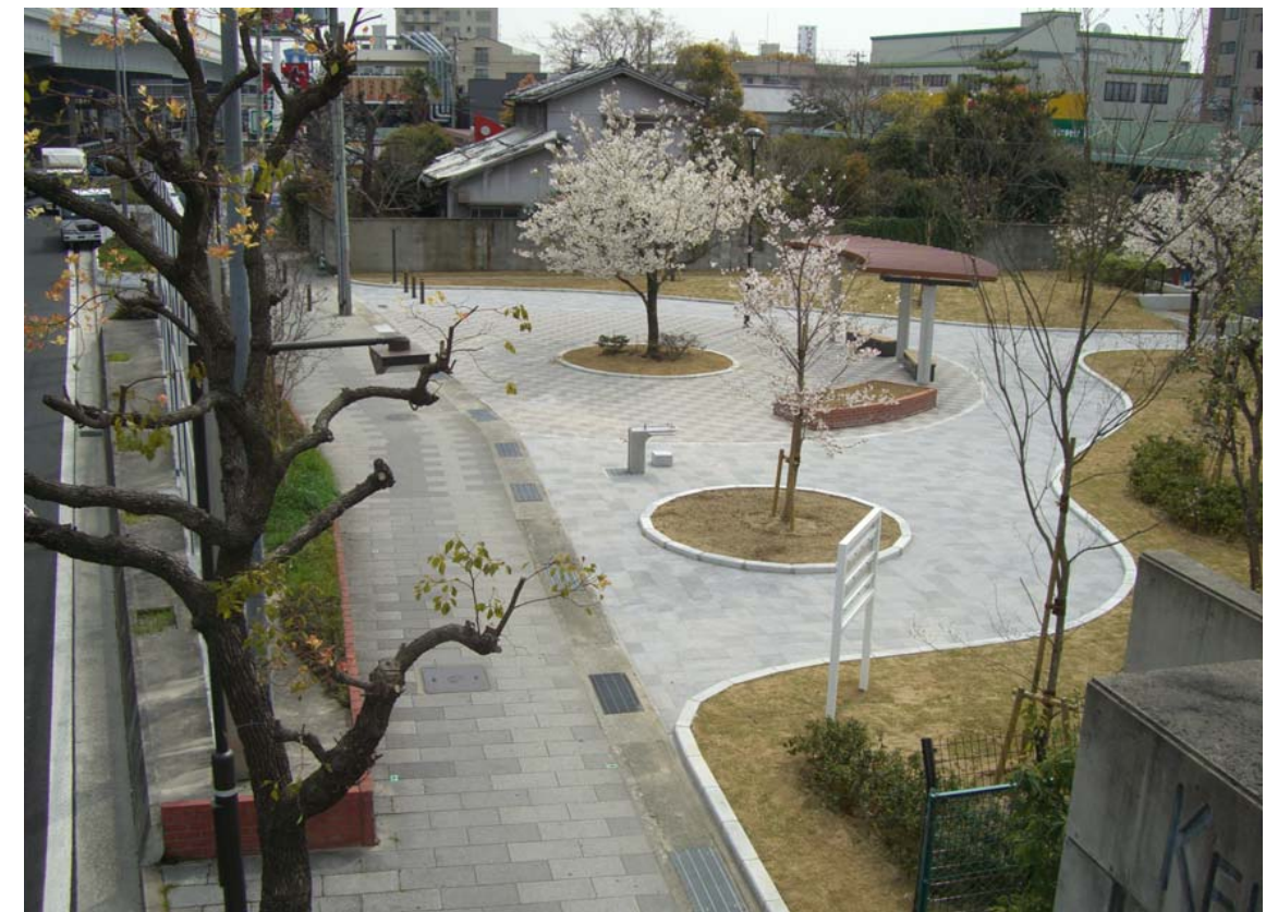
環境防災緑地「利用型」：広場として整備 (西宮市宮前町)