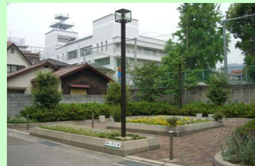
花壇等、広場として整備 (芦屋市精道町)

利用型は、住民のみなさんの要望を反映した整備を行い、沿道市及び地域の団体のみなさんが管理をしています。