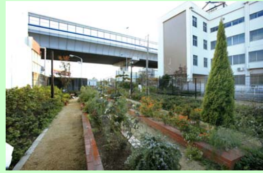
花壇として整備 (神戸市東灘区御影町)