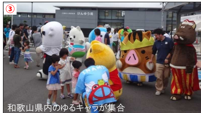
③ 和歌山県内のゆるキャラが集合