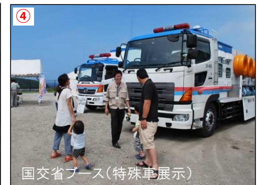
④ 国交省ブース(特殊車展示)