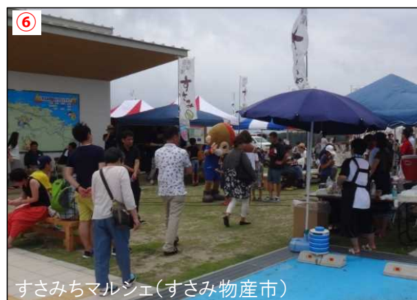
⑥ すさみちマルシェ(すさみ物産市)