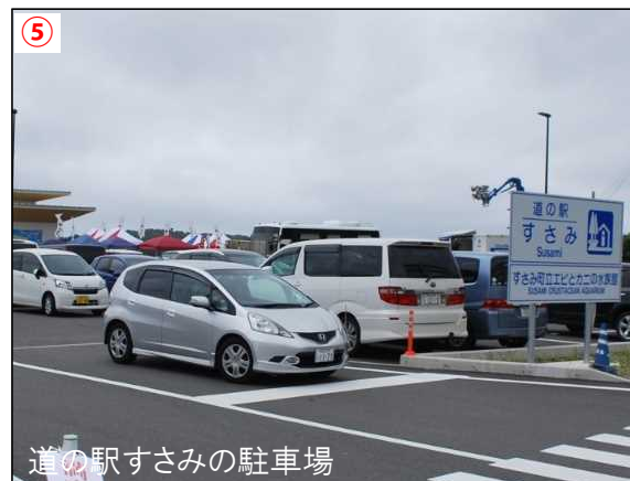
⑤ 道の駅すさみの駐車場