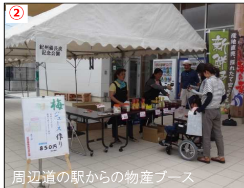
② 周辺道の駅からの物産ブース