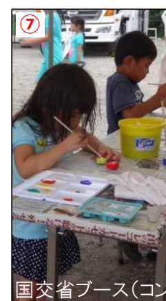
⑦ 国交省ブース(コンクリート塗絵、アーチ橋体験)