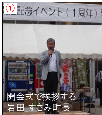
① 記念イベント(1周年) 開会式で挨拶する 岩田 すさみ町長