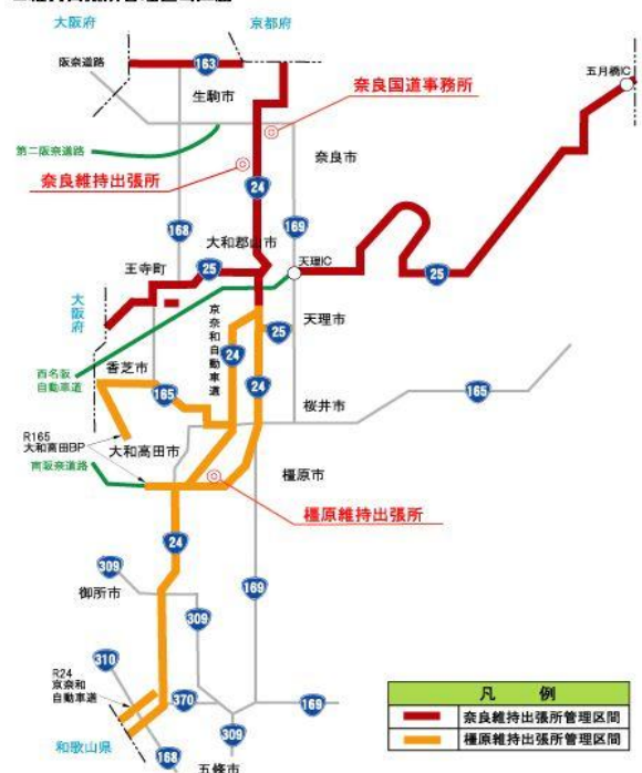
■維持出張所管理担当区間