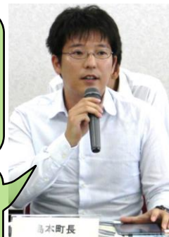
島本町長 島本町長

・水防法改正の要配慮者利用施設における避難情報の入手や避難計画作成について、町内の要配慮者利用施設の管理者向けに説明会を行った。 ・6月に町全住民を対象とした夜間の風水害避難訓練を行った。