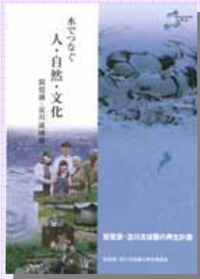
「琵琶湖淀川流域圏の再生計画」 (平成17年3月策定)