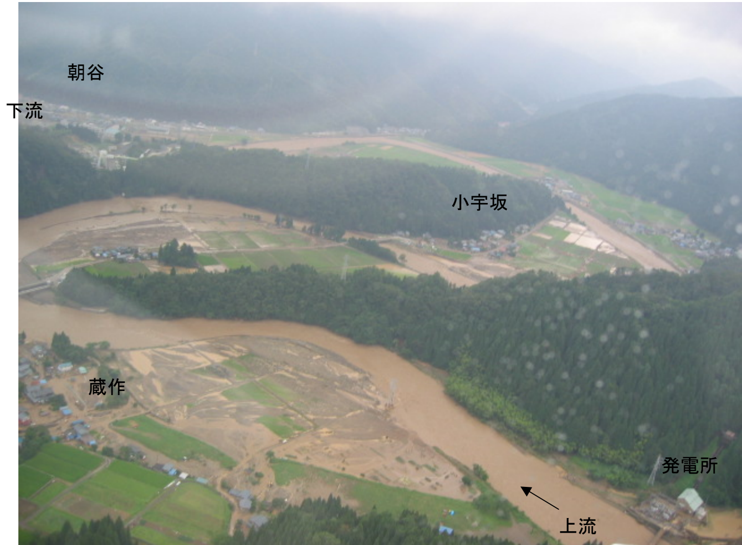
美山町蔵作(足羽川)