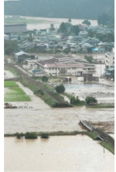
JR越美北線鉄道橋 被災箇所