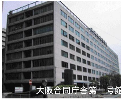
大阪合同庁舎第一号館