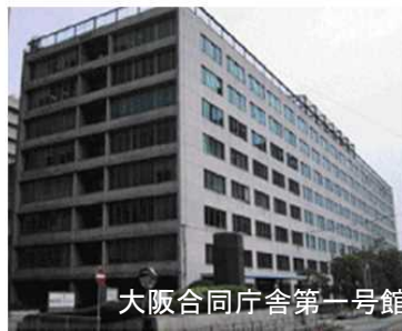
大阪合同庁舎第1号館