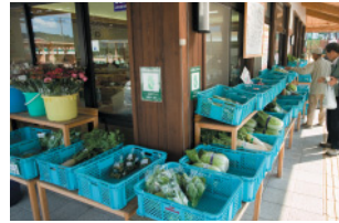
建家外周りにズラリと野菜。