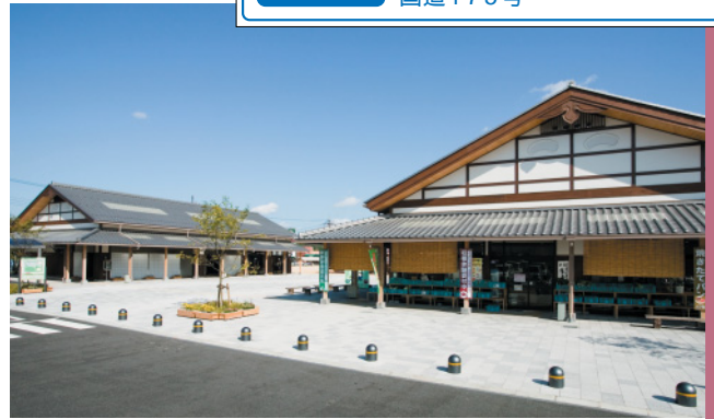
手前が特産販売所、奥は休憩所。