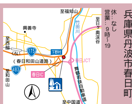
兵庫 丹波市 春日町 休業：なし 営業：9時～19時