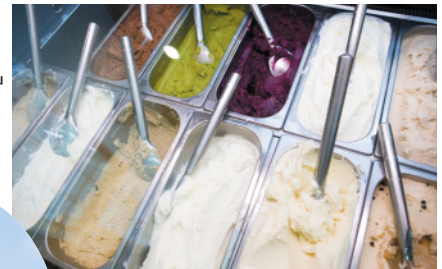
濃厚！各種ジェラート。ちょっと寒いけど、春まで待っていられないでしょ。