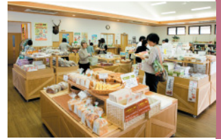
特産販売所は通路も広々。