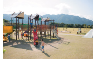
奥の方まで芝生広場が続く。