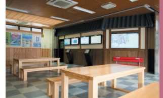
ベビールームもある休憩所。