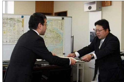
◇表彰状を受け取る木部建設株式会社の木部代表取締役社長

トンネル施工において、計画に基づいた高精度な掘削品質の確保や高品質な覆工コンクリートの施工に貢献したことが評価されました。