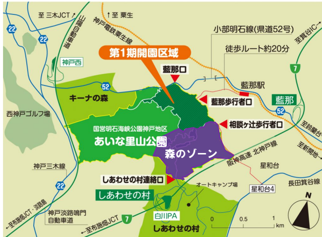
国営明石海峡公園神戸地区 位置図

国営明石海峡公園神戸地区（神戸市北区・西区、愛称：あいな里山公園）では、「森のゾーン」において官民連携事業の導入に向けた検討を進めています。このたび、民間事業者の皆様との対話を通じて事業のアイデアや参画条件などを把握するため、マーケットサウンディング調査を実施しました。