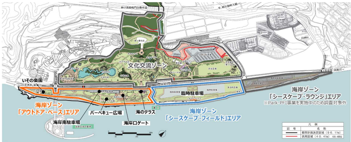
図 淡路地区整備計画（国営明石海峡公園基本計画（平成 29 年 6 月）を基に作成）