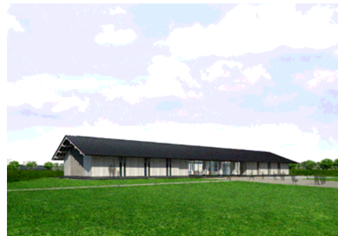
■復原事業情報館の整備イメージ