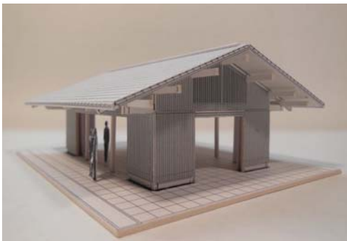
■休憩所の整備イメージ