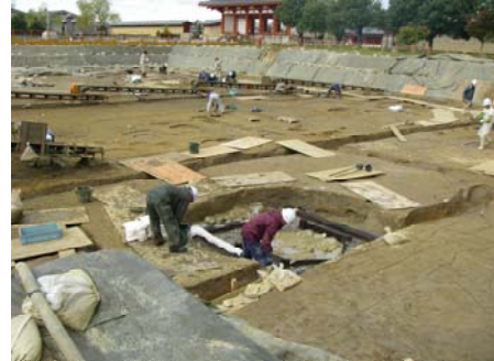
■平城宮跡展示館整備予定地での発掘調査

また、隣接する北新大池内の試掘調査についても昨年度に引き続き遺溝の有無を確認します。