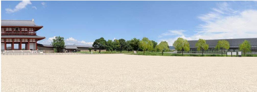
■平城宮跡展示館の整備イメージ（右側）

国営平城宮跡歴史公園の正面玄関口として、園内の案内・利用情報の提供にあわせ、「平城宮跡に対する知識と理解を深めるためのガイダンス」や、「出土品の展示」等を行う施設です。