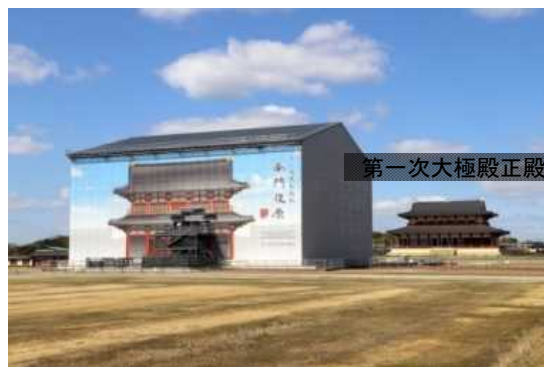
第一次大極殿院 南門素屋根