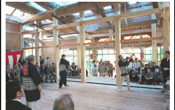
参考：第一次大極殿正殿の式典の様子（文化庁実施）