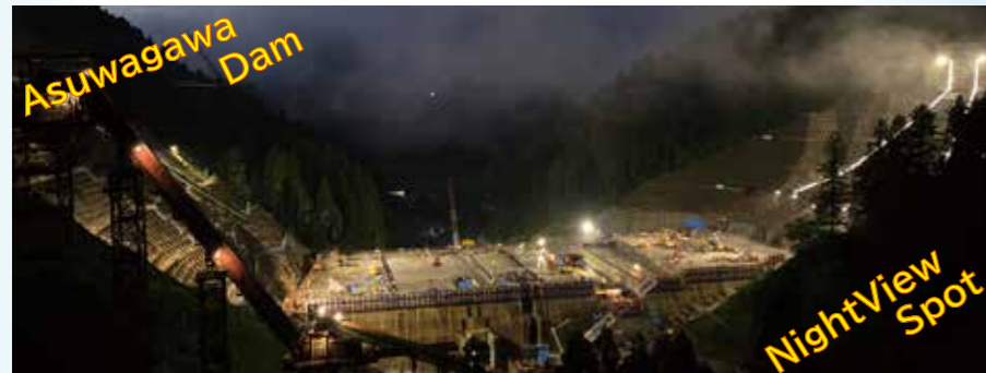
ダム本体工事 (令和6年7月時点)