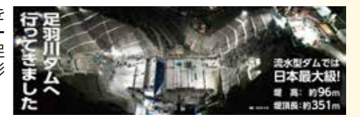
足羽川ダムへ行って来ました

足羽川ダム本体の完成イメージを7.1m×2.3mの迫力ある巨大スクリーンに再現しました。まだ見ぬ完成後の足羽川ダムと一緒に、一足早い記念撮影をどうぞ。