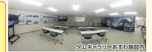
ダムギャラリーあすわ施設内

開放期間 4月～11月、 平日9時～16時 無料 定休日 土日祝 駐車台数 16台、バス1台