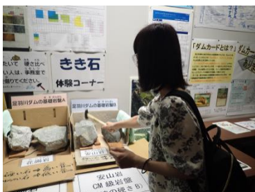
■きき石体験コーナー