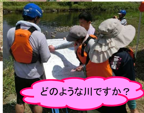
■ 水質の感覚指標調査