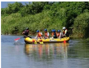
■ ラフティング体験