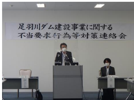
福井県警察本部 組織犯罪対策課長の挨拶