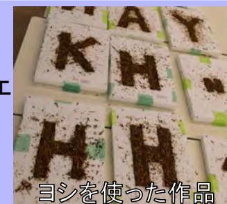
ヨシを使った作品