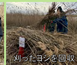
刈ったヨシを回収