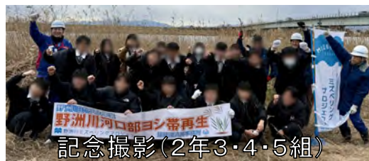
記念撮影(2年3・4・5組)