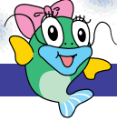
ピワズくんの妹 “アクア”ちゃん