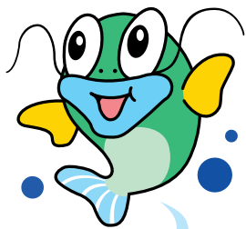
アケア琵琶のマスコット「ビワズくん」