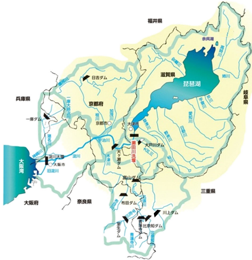
淀川水系の流域図