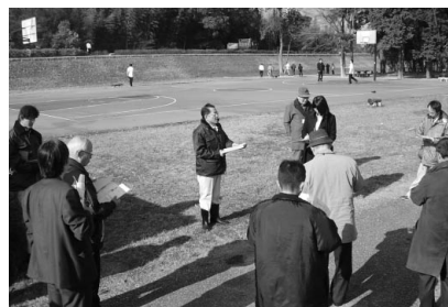
野洲川運動公園（栗東市）