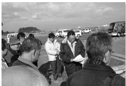
野洲川立入河川公園（守山市）