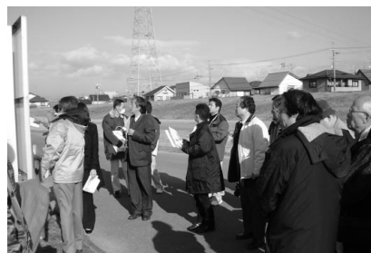
野洲川河川公園（野洲市）