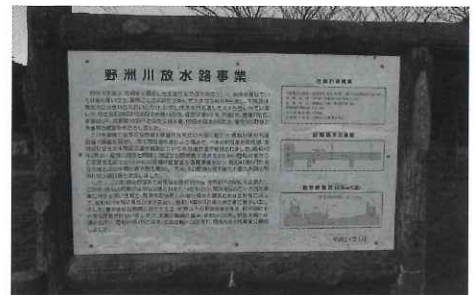
野洲川放水路事業看板（野洲川改修記念公園内）