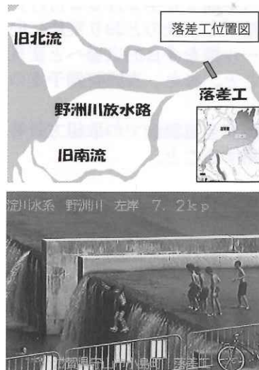
落差工での危険利用例（飛び込み）