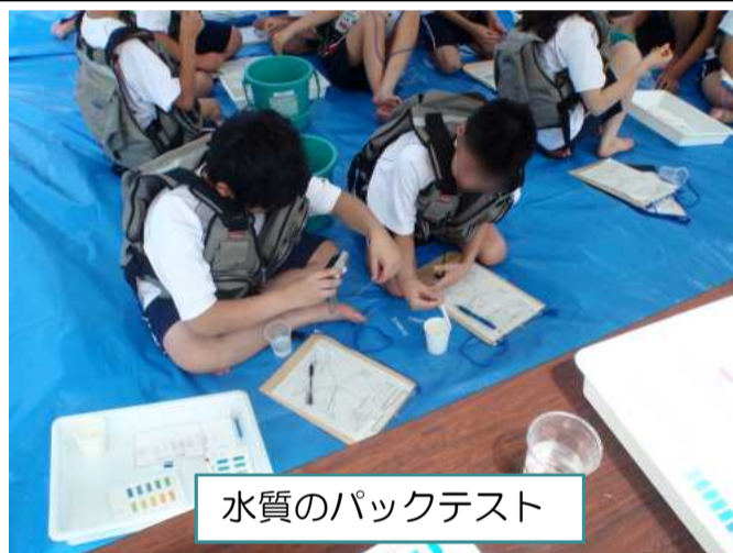
水質のパックテスト