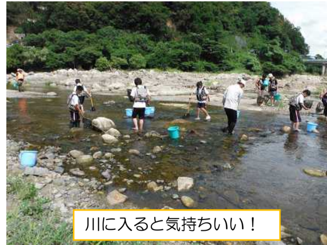
川に入ると気持ちいい！