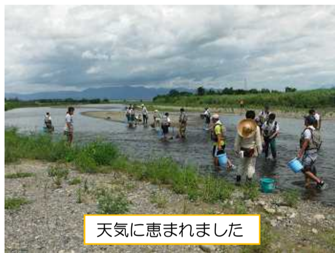
天気に恵まれました