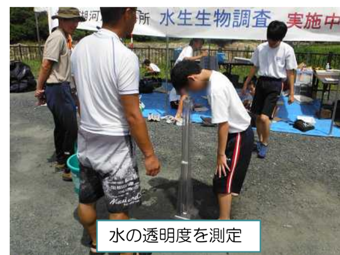
水の透明度を測定