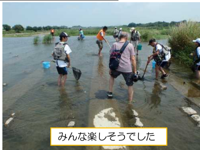
みんな楽しそうでした