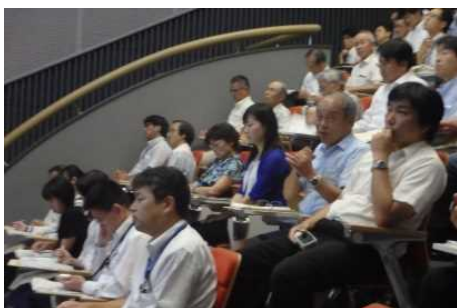
一般の方からも熱心に質問がありました。