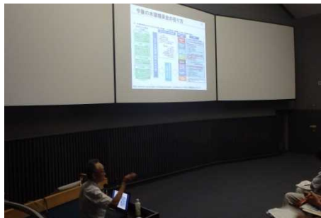
質問に対し、回答を説明