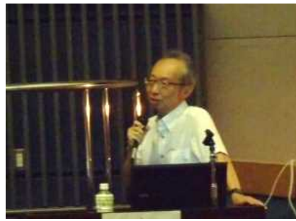
最新の水質保全の動向を説明