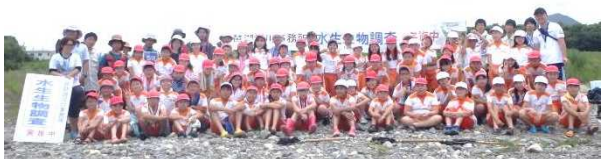
みんなで記念撮影