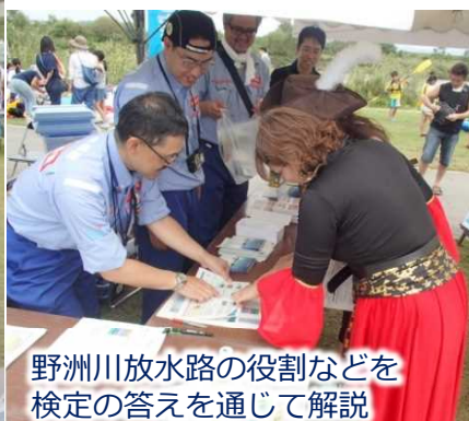
野洲川放水路の役割などを 検定の答えを通じて解説