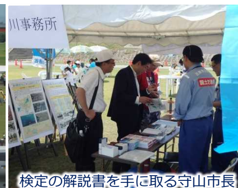
検定の解説書を手にする守山市長