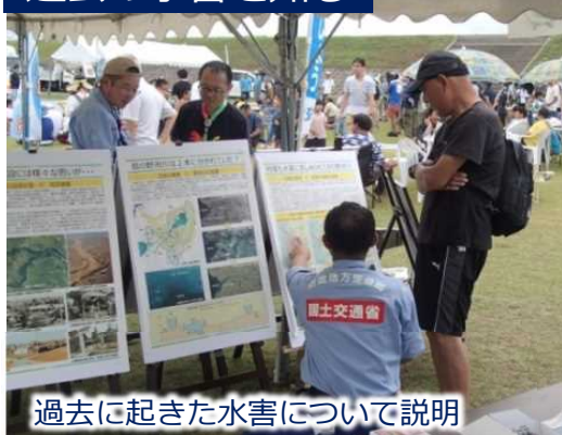
過去に起きた水害について説明