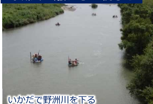
いかだで野洲川を下る