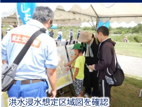
洪水浸水想定区域図を確認