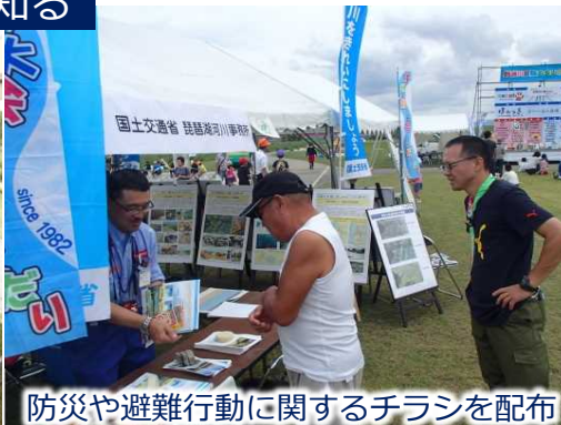
防災や避難行動に関するチラシを配布