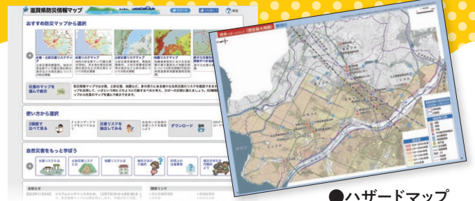
●ハザードマップ ってなに?