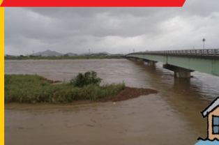
※平成25年台風18号時の状況