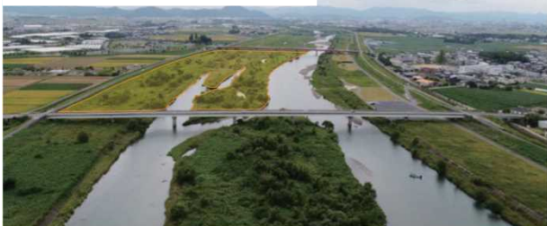
服部大橋から新庄大橋付近の様子