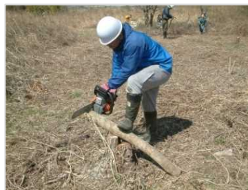
～昨年の伐採の様子～