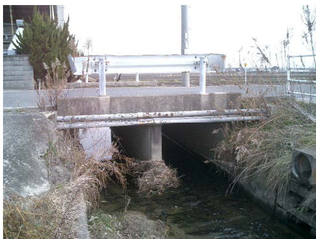
通水阻害の河川整備