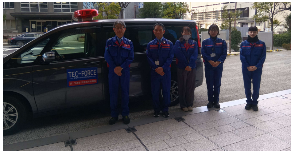
乗員保護支援班出発式