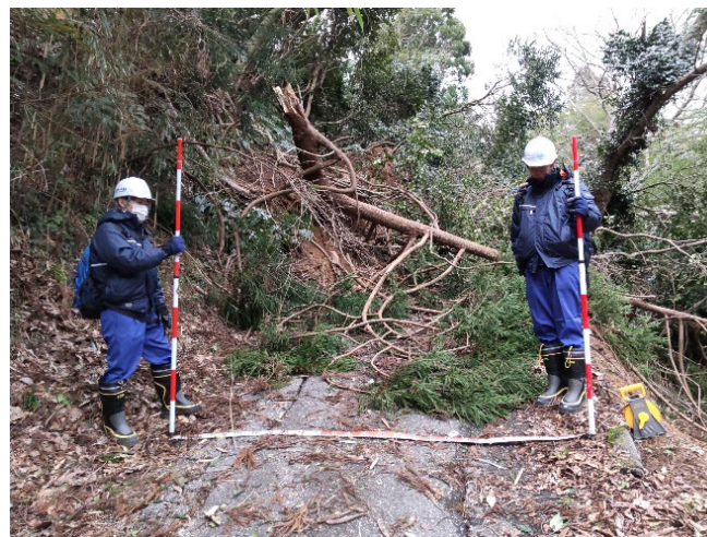
【道路班】珠洲市 被災調査（1日）