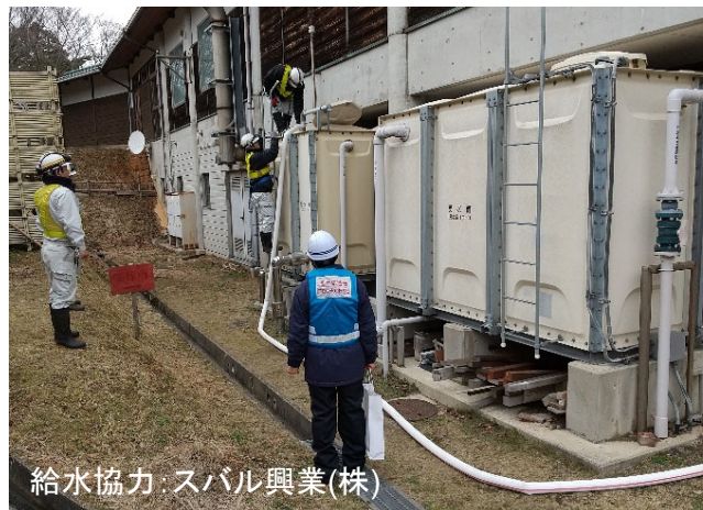
給水協力：スバル興業(株)