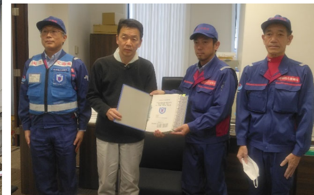
【砂防班】輪島市 報告書手交（1日）