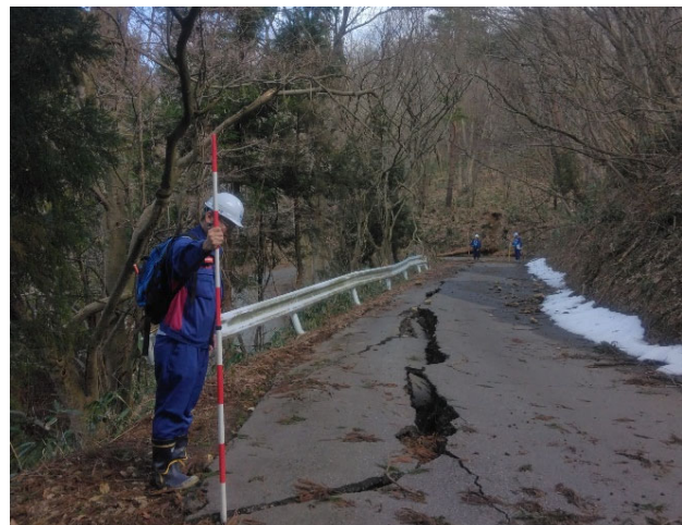
【道路班】輪島市 被災状況調査（14日）