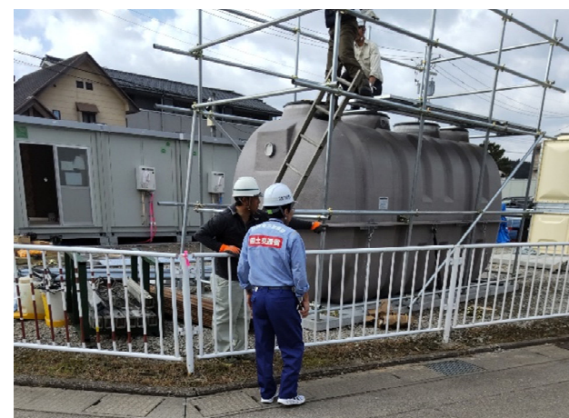
【水道班】穴水町 調査状況（14日）