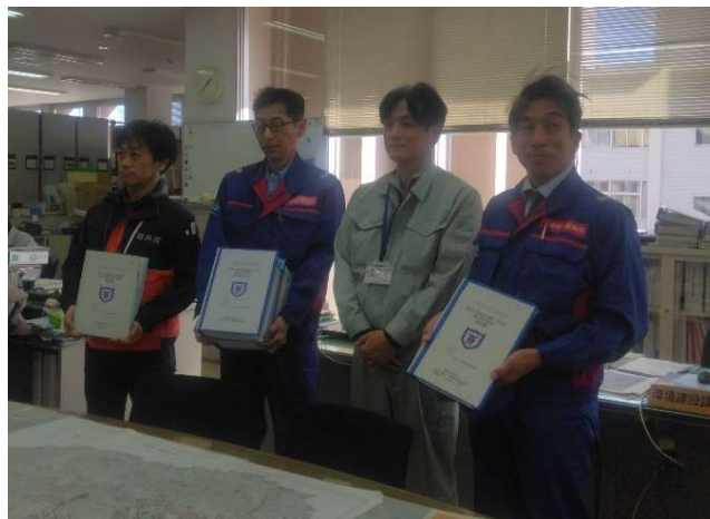
【道路班】珠洲市 報告書手交（4日）