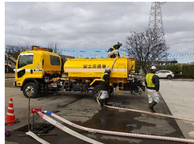
【給水班】金沢市 作業状況（4日）