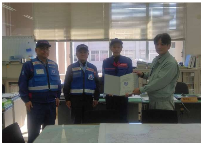
【砂防班】珠洲市 報告書手交（4日）