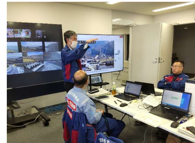
【先遣班】新潟市 打ち合わせ状況（11日）