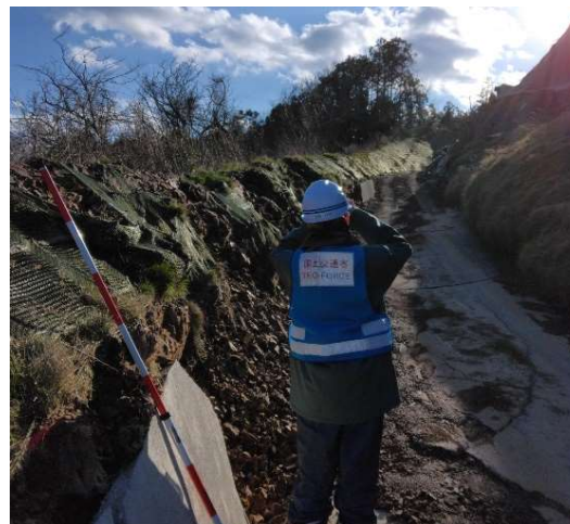
【道路班】輪島市 被災状況調査（11日）