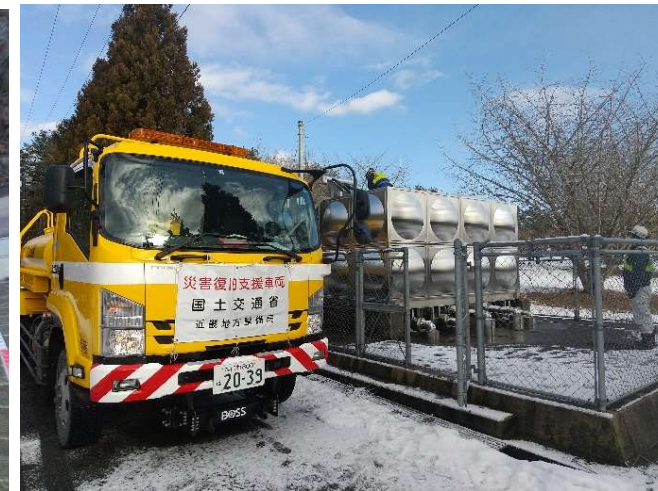
【給水班】能登町 給水状況（11日）