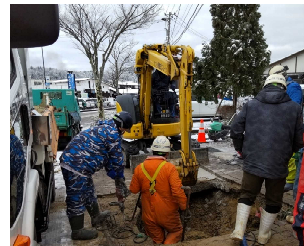
【水道班】穴水町 日水協（神戸市）と修繕箇所及び 資材調達の確認（14日）