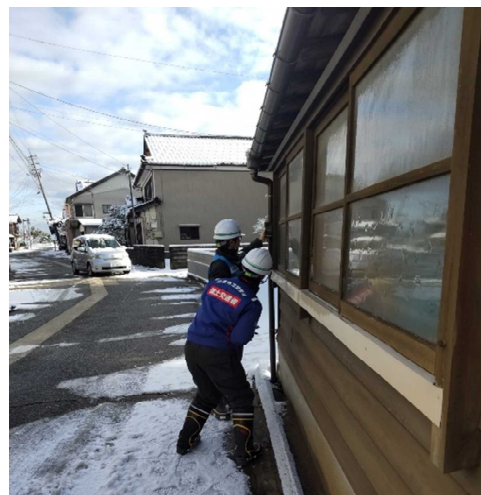
【営繕班】能登町 作業状況（14日）