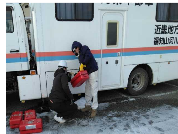
【応急対策班】飯田港 災害対策本部車(14日)