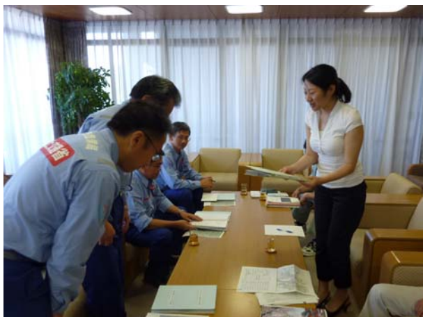
大津市長に道路被害調査結果を報告（8月20日）