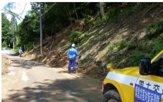
市道久田底広線ほか踏査（8月19日）