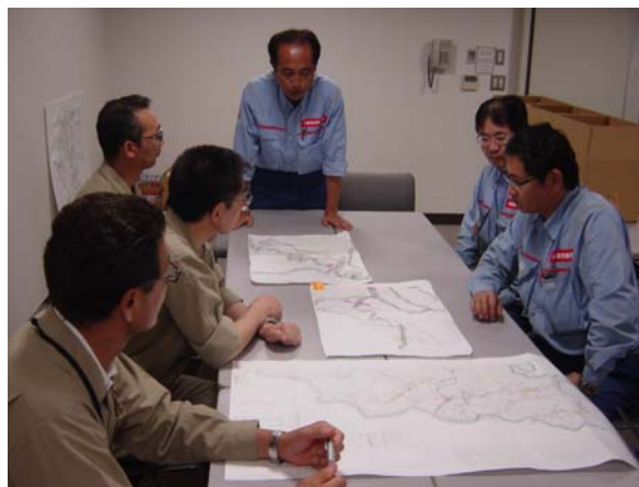
TEC-FORCE道路班の調査速報を宇治市役所に報告（8月18日）