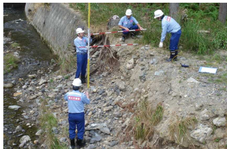
被災状況調査(木住川)