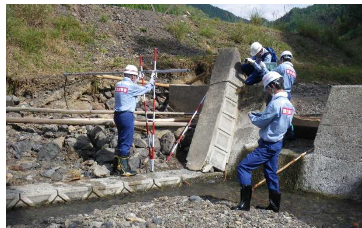
被災状況調査(中世木川)