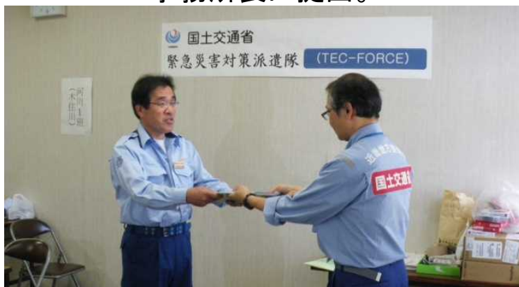
南丹広域振興局長へ調査成果の引渡(10月4日)

◇実施内容:被災状況調査をとりまとめ、調査成果報告書を南丹広域振興局長、南丹土木事務所長に提出。