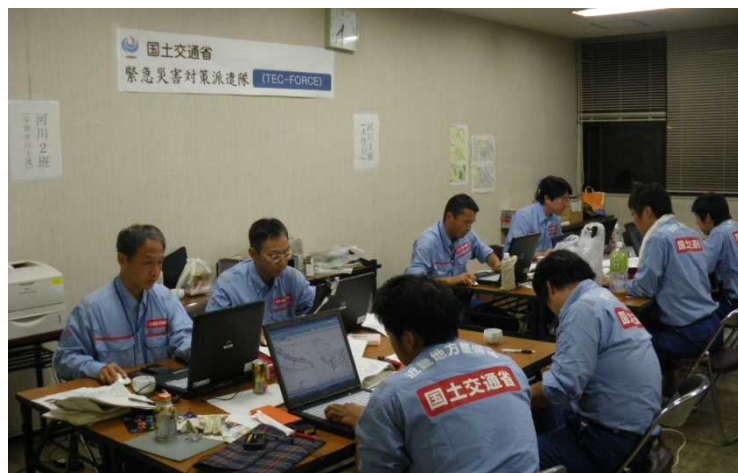
調査成果報告書作成(10月3日)