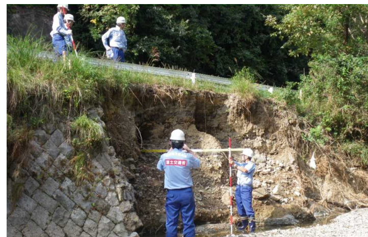
被災状況調査(木住川)(10月3日)