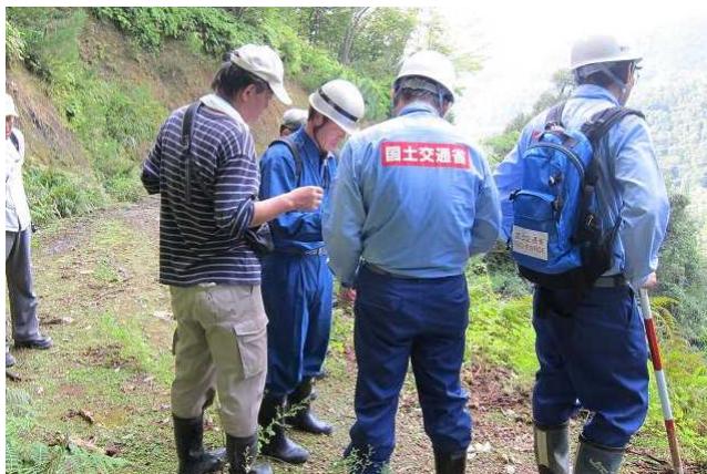
被災箇所の調査(加茂地区)