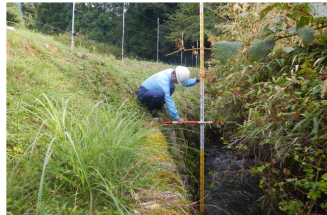
被災箇所の調査(毛原地区)