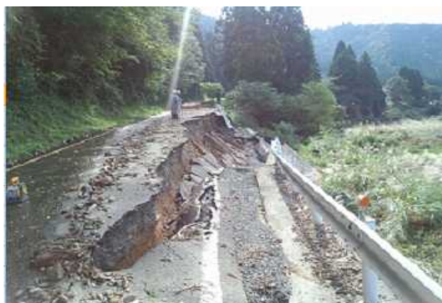
道路法面崩落箇所の調査(朽木麻生地区)