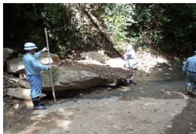
路肩欠損被災箇所の調査(黒谷地区)