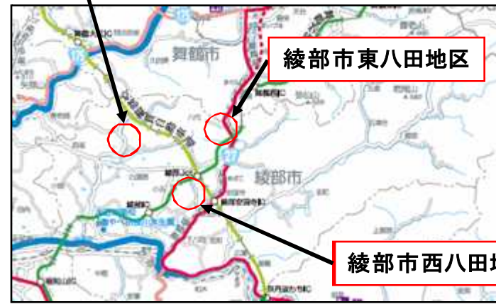
綾部市東八田地区