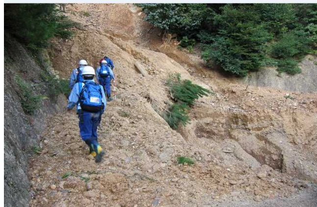
被災箇所の調査(加茂地区)