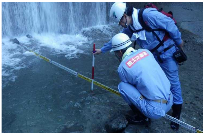
被災箇所の調査(中ノ畑地区)