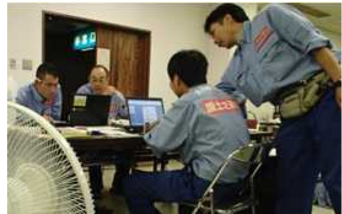
調査成果のとりまとめ