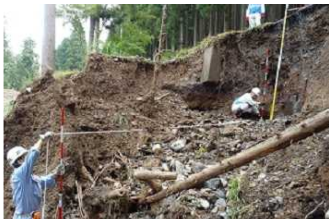
土砂、樹木流出被災箇所の調査(朽木柏地区)