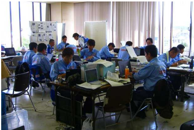
調査成果とりまとめ