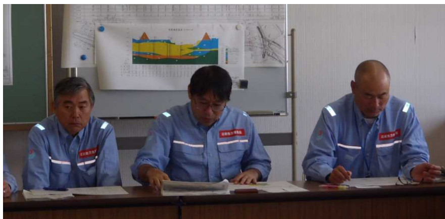
診断結果を講評するTEC-FORCE