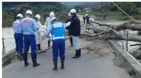
台風27号により被災した 在田橋(府道492号)