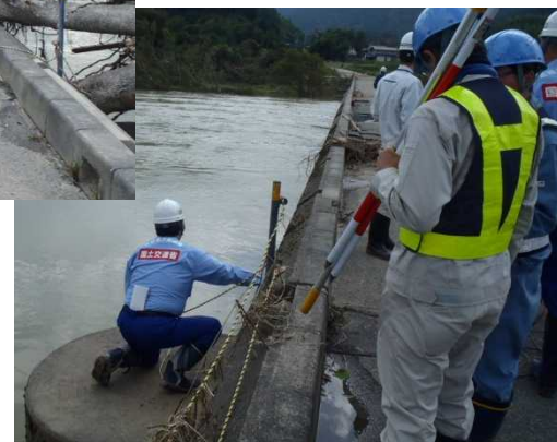
被災場所の調査・診断の様子